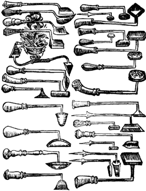
VARIOUS CAUTERIES, AND A BRASIER. FROM PARÉ'S WORKS.