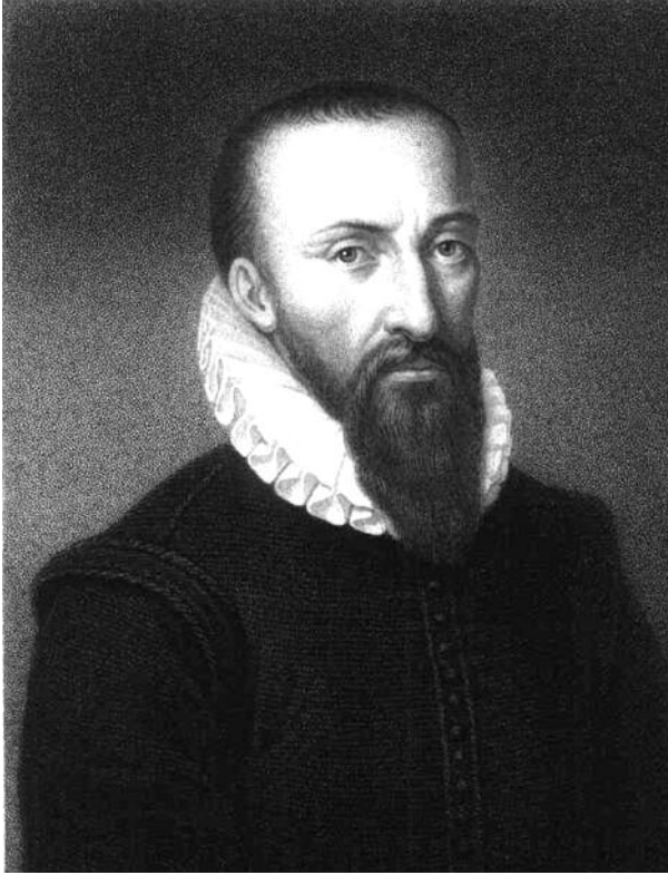
Şekil-1. Ambroise Paré

1510 yılında Fransa'da Bourg Herent'de doğan Paré, 4 kral boyunca Paris'te hekimlik yapmıştır. Çocukluğu hakkında çok fazla bilgi yoktur ancak küçük köyünde huzurlu bir çocukluk geçirdiği varsayılır. Babasının ve diğer birçok akrabasının berber ya da eczacı olması kendisinin hekim olmasında etkili olmuştur şüphesiz.